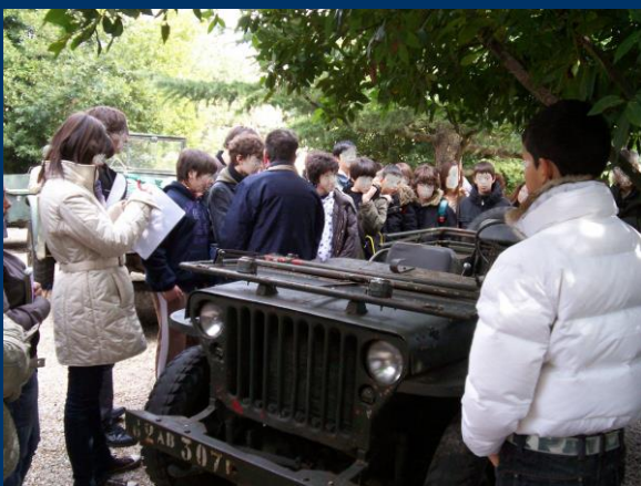
Ogni anno centinaia di studenti provenienti da scuole di ogni ordine e grado, italiani e stranieri, fanno visita al Museo Storico Internazionale della Linea Gotica di Casinina.